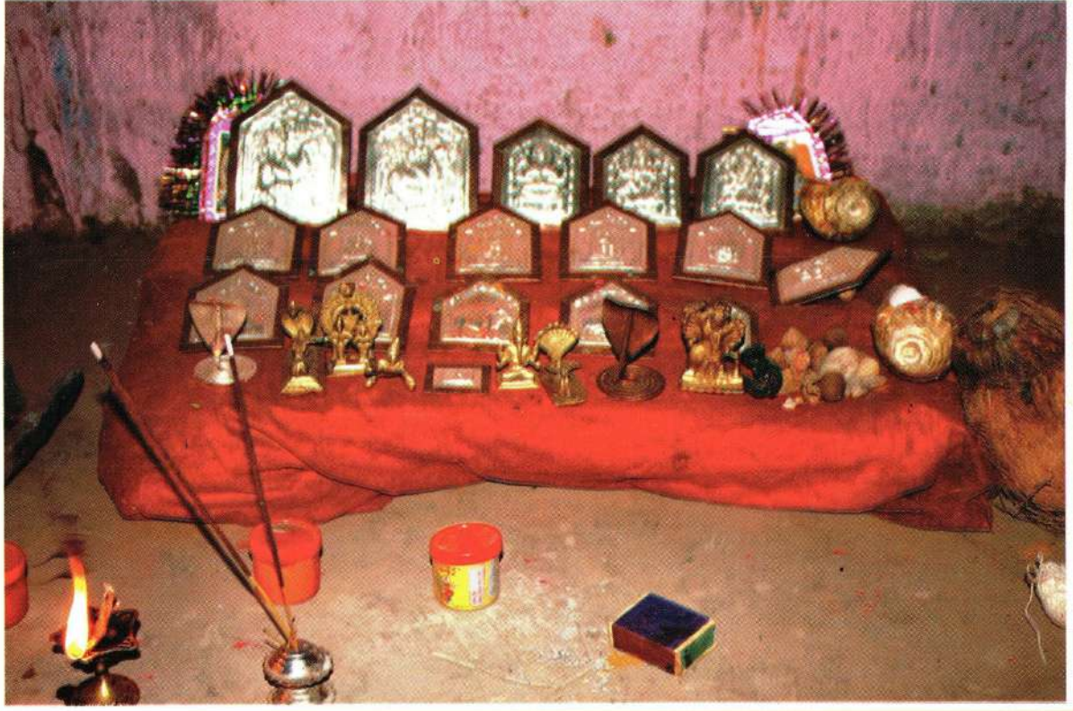
कोकणा जमातीचे देव-देवता