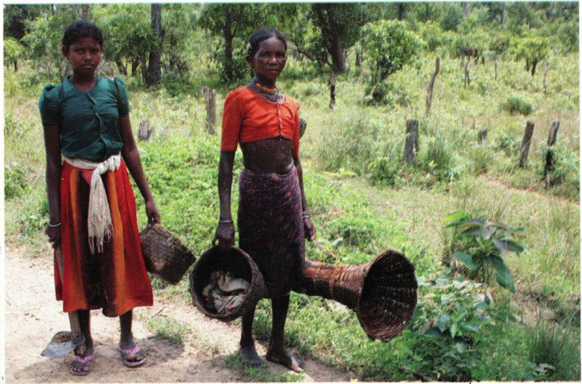
साधने घेऊन मासेमारीसाठी जाताना माडिया जमातीची स्त्री व मुलगी