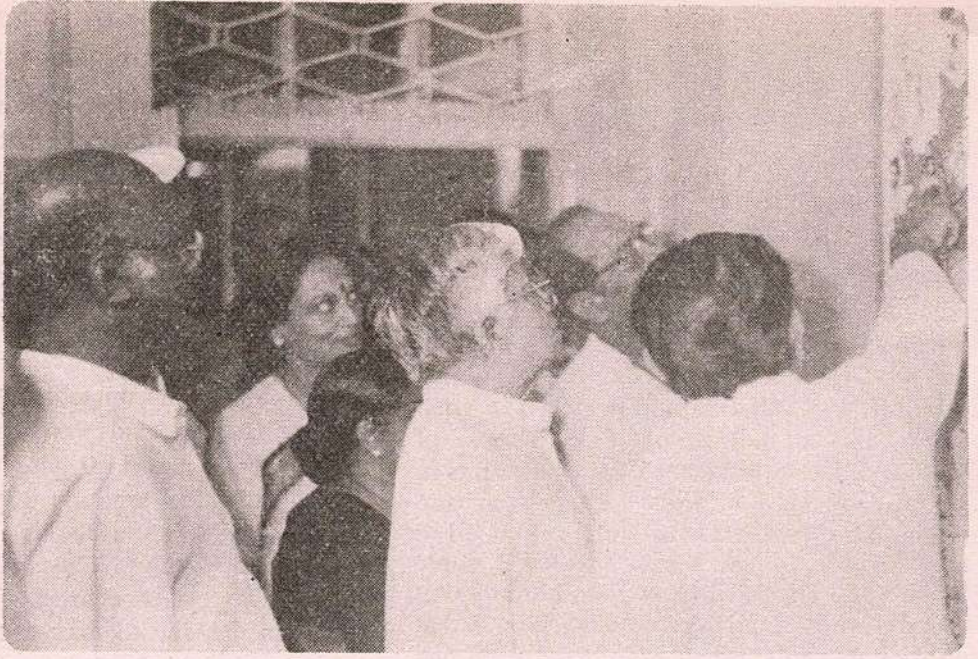
मा. श्री. सी. सुब्रमण्यम्, राज्यपाल, संस्थेच्या संग्रहालयातील नकाशा पाहताना.