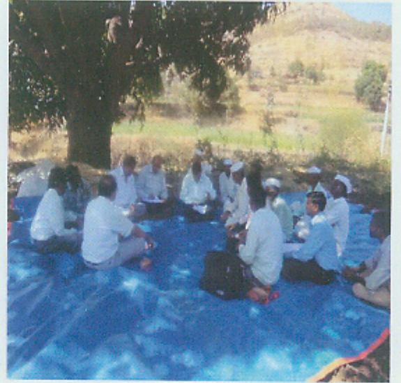
लाभार्थ्यांच्या प्रत्यक्ष भेटी व माहितीचे संकलन