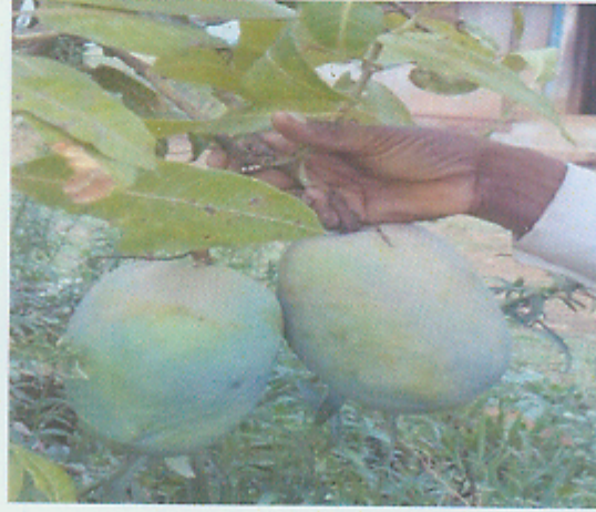
आंब्याचे उत्पादन दाखविताना लाभार्थी