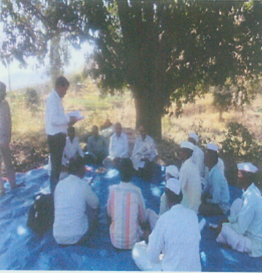
लाभार्थ्यांच्या प्रत्यक्ष भेटी व माहितीचे संकलन

वरील 'अ' ते 'ड' चे अवलोकन केले असता लाभापूर्वीच्या लाभार्थ्यांच्या संख्येमध्ये लाभानंतर वाढ होत असल्याचे दिसून आले.