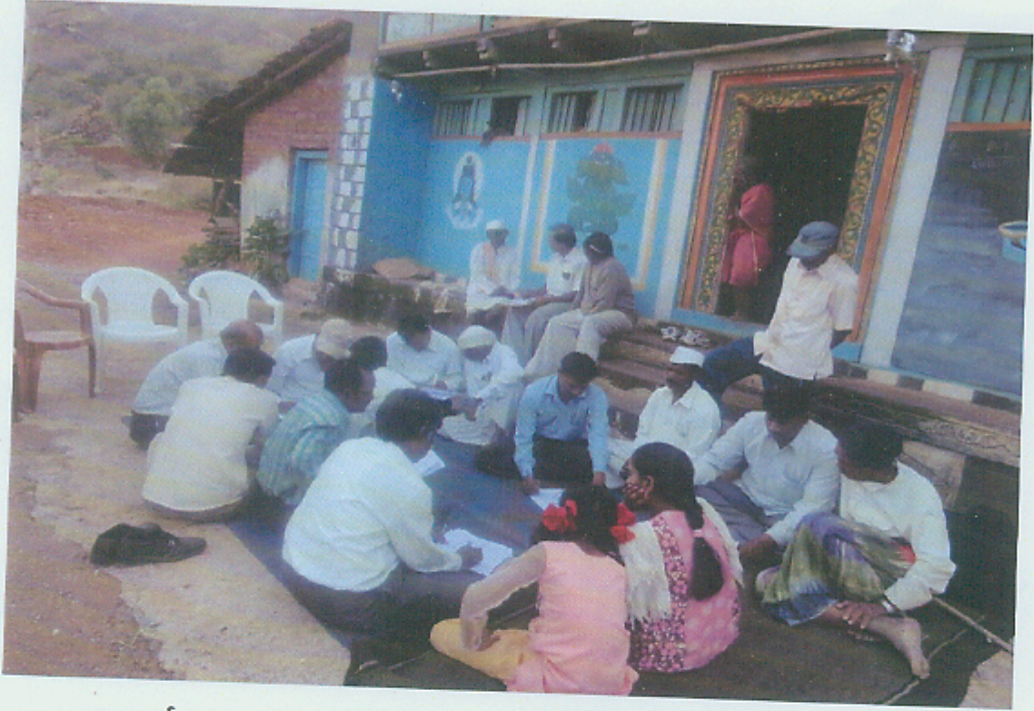
लाभार्थ्यांकडून प्रत्यक्ष माहिती प्रपत्रे भरून घेताना अधिकारी व कर्मचारीवृंद