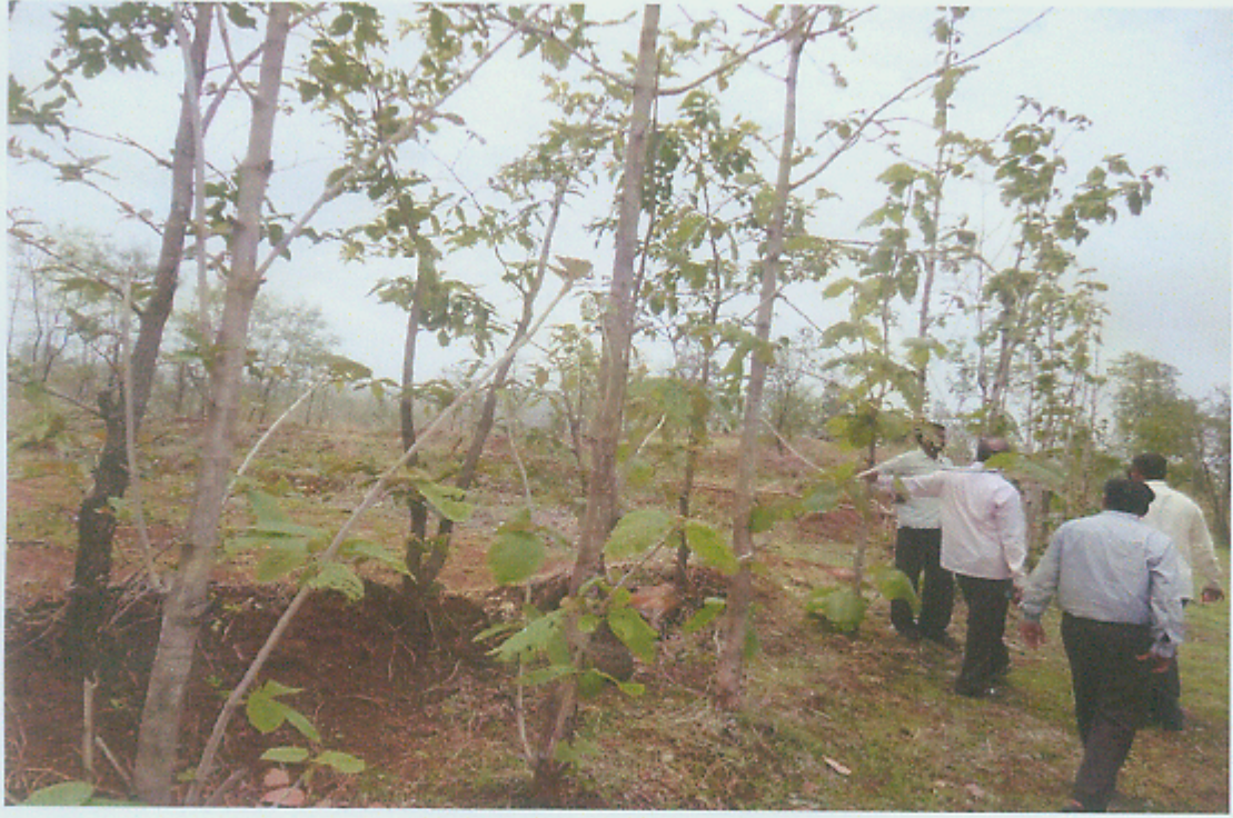
सागवान रोपांची झालेली वाढ