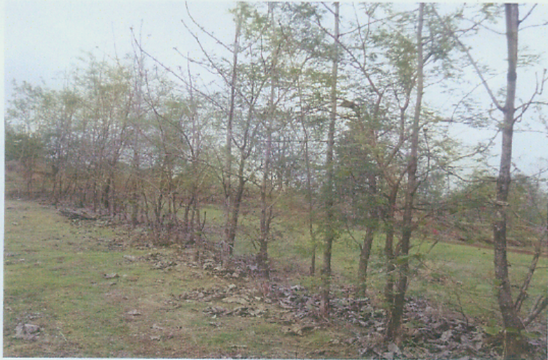
सुबाभूळ रोपांची झालेली वाढ