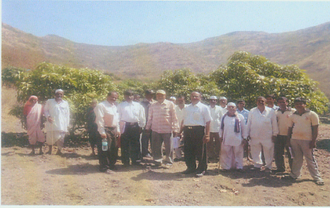
वाडीची पाहणी करताना अधिकारी / कर्मचारीवृंद आणि वाडी कार्यक्रमाचे लाभार्थी