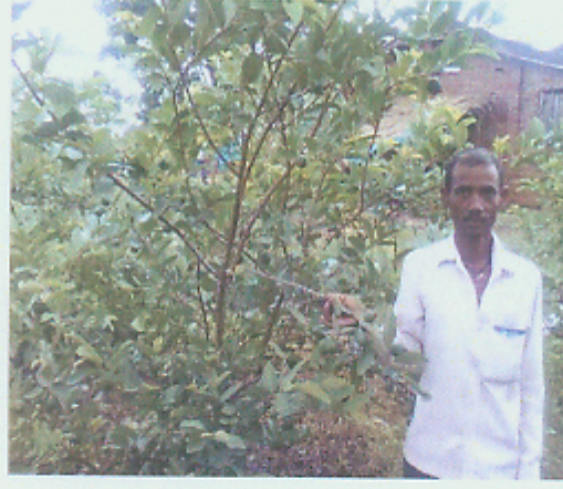
पेरूचे उत्पादन दाखविताना लाभार्थी