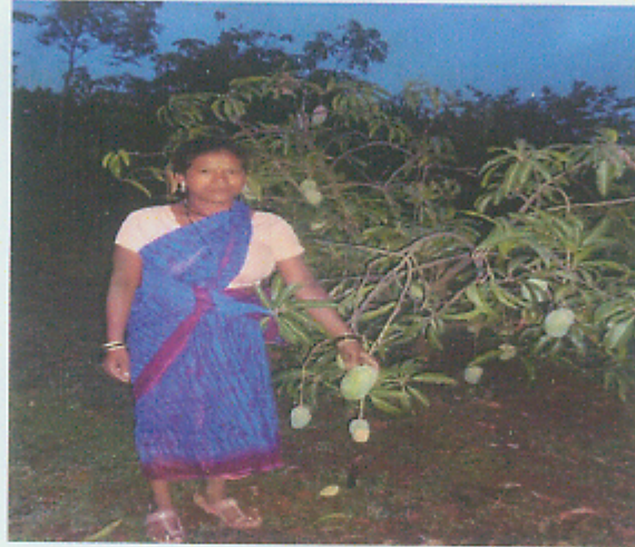
आंब्याचे उत्पादन दाखविताना लाभार्थी महिला