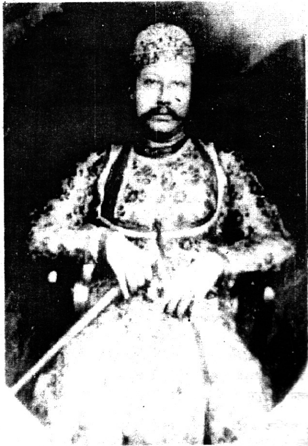
আজমা বীরচন্দ্র মাণিক্য