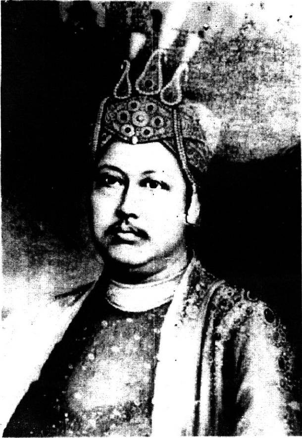
আজমা ঈশানচন্দ্র মাণিক্য