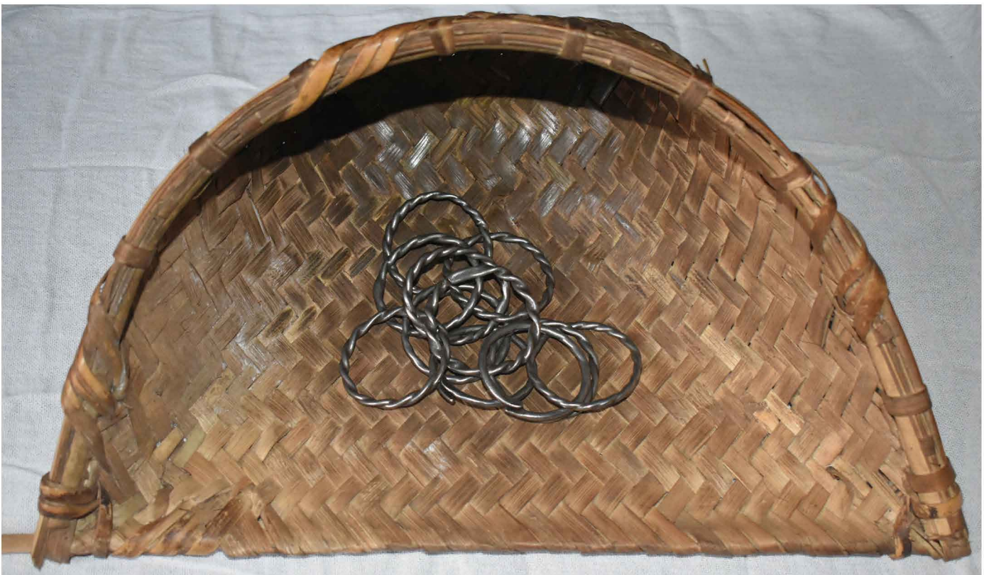
ചിത്രം: 31 മുറം കുലുക്കിപ്പാട്ടിന്റെ മുറവും ചങ്ങലയും 32