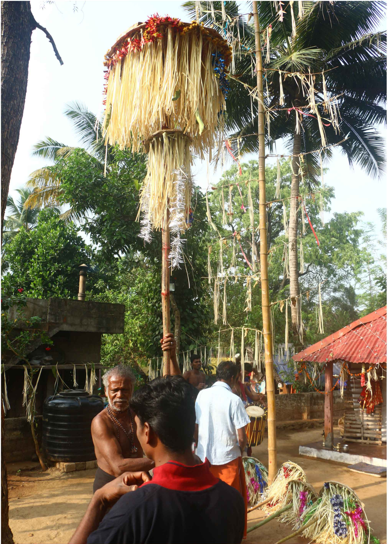
ചിത്രം: 34 നെടിയ കൂട 38