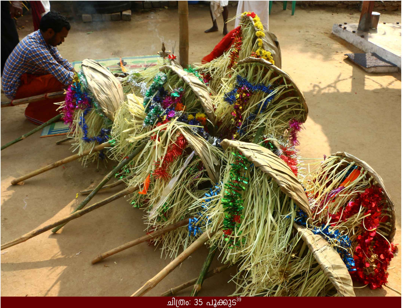
ചിത്രം: 35 പൂക്കൂട്ട് 39

വൃശ്ചികം 28 ന് മുപ്പന്റെ നേതൃത്വത്തിൽ കൂട്ടായ പ്രാർത്ഥനക്ക് ശേഷം തലേദിവസം തയ്യാറാക്കിയ കതിർക്കൂട്ടുകൾ 'പണ്ടാരത്തണ്ട്' അഥവാ കതിർത്തണ്ടിലേക്ക് കയറ്റുന്നു. 'കവര'യുടെ മുകളിൽ കയറ്റി വെയ്ക്കുന്ന കതിർത്തണ്ടിന് ദേവിയോളം/ കുറുമാലിയമ്മയോളം പ്രാധാന്യമുണ്ട്. മലയരുടെ മനസ്സിൽ പൂജാരികൂടിയായ മുപ്പൻ കതിർത്തണ്ട് മഞ്ഞൾവെള്ളം തളിച്ച് ശുദ്ധിയാക്കുകയും കുകുമവും ചന്ദനവും ചാർത്തുകയും ചെയ്യുന്നു. ശേഷമാണ് കതിർക്കൂട്ടും വിത്തുകളും പണ്ടാരത്തണ്ടിലേക്ക് കയറ്റുന്നത്.