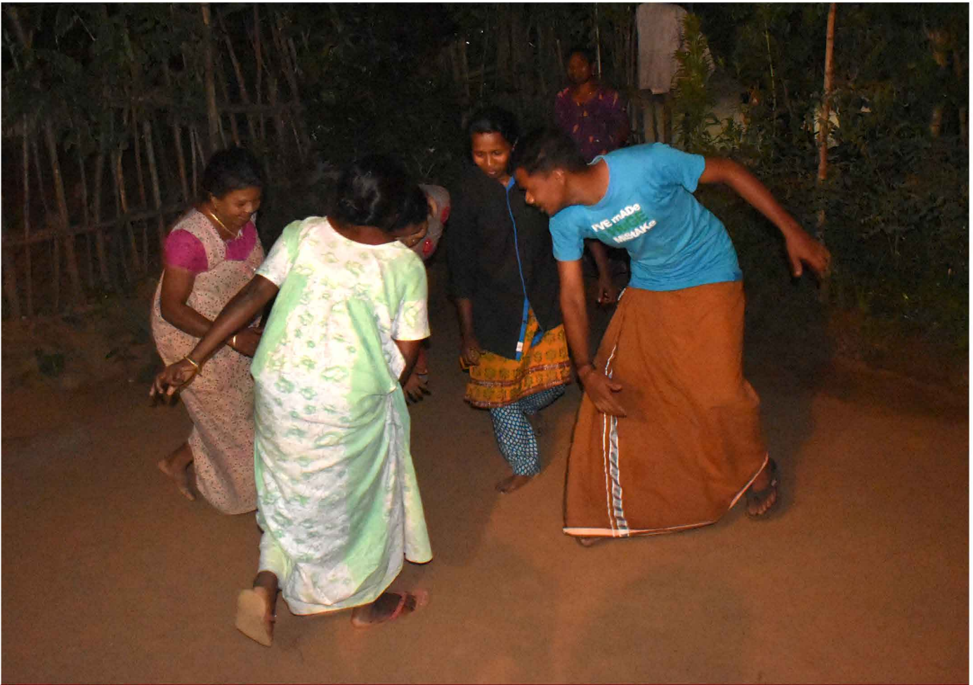
ചിത്രം: 38 പോലിക്കളി 42

അലങ്കരിച്ചു വച്ച പന്തലിന്റെ സൗന്ദര്യം മുഴുവൻ പാടി പുകഴ്ത്തി പാട്ടുകാരൻ അന്തരീക്ഷം സംഗീത സാന്ദ്രമാക്കുമ്പോൾ, പാട്ടിന്റെ താള തോടലിഞ്ഞുചേർന്ന്, വട്ടത്തിൽ നിന്ന്, നൃത്തച്ചുവടുകൾ വെയ് ക്കുന്ന ആണും പെണ്ണും അവരുടെ സന്തോഷവും സമ്മാനിക്കുന്നത് ഒരു പ്രത്യേകതരം അനുഭൂതിയാണ്.