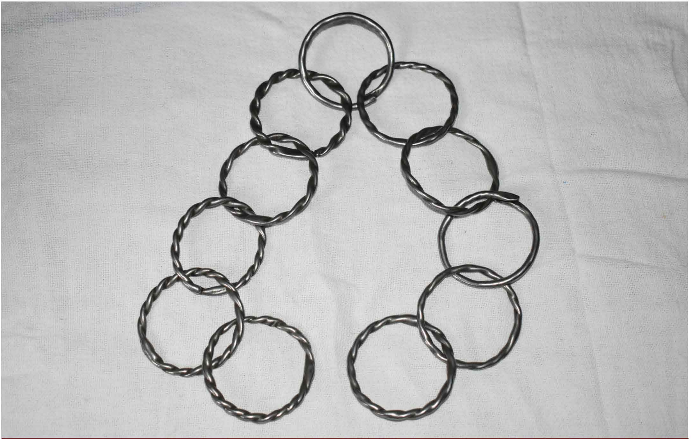
ചിത്രം: 30 പതിനൊന്ന് വളയങ്ങളുള്ള ചങ്ങല 31