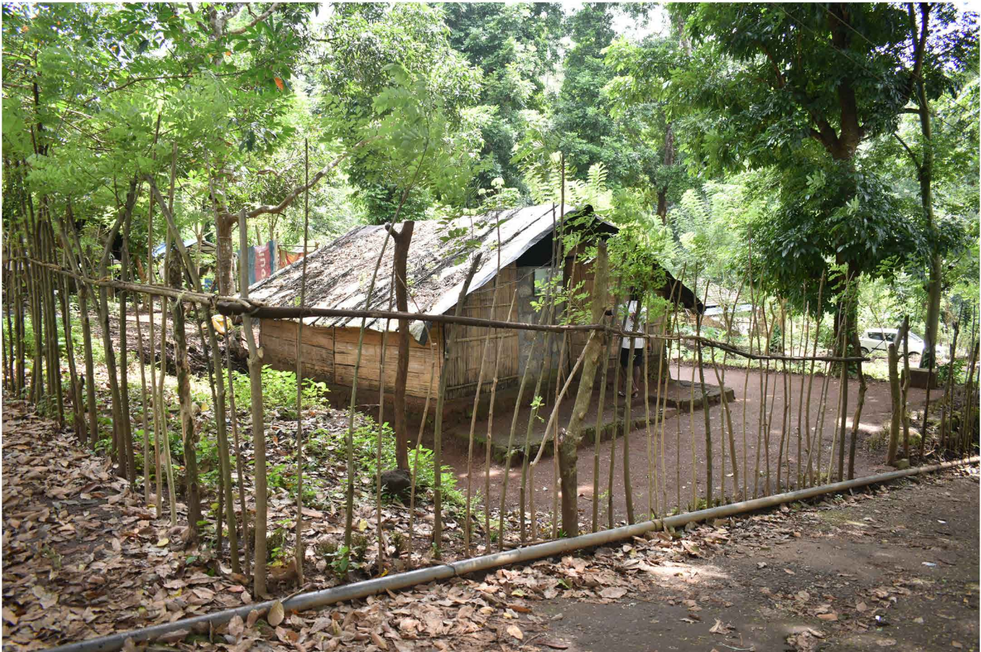
ചിത്രം: 27 തൃശ്ശൂർ ജില്ലയിലെ മണിയൻ കിണർ പ്രദേശത്തെ ഒരു പരമ്പരാഗത കൊങ്ങമലയ വീട് 28