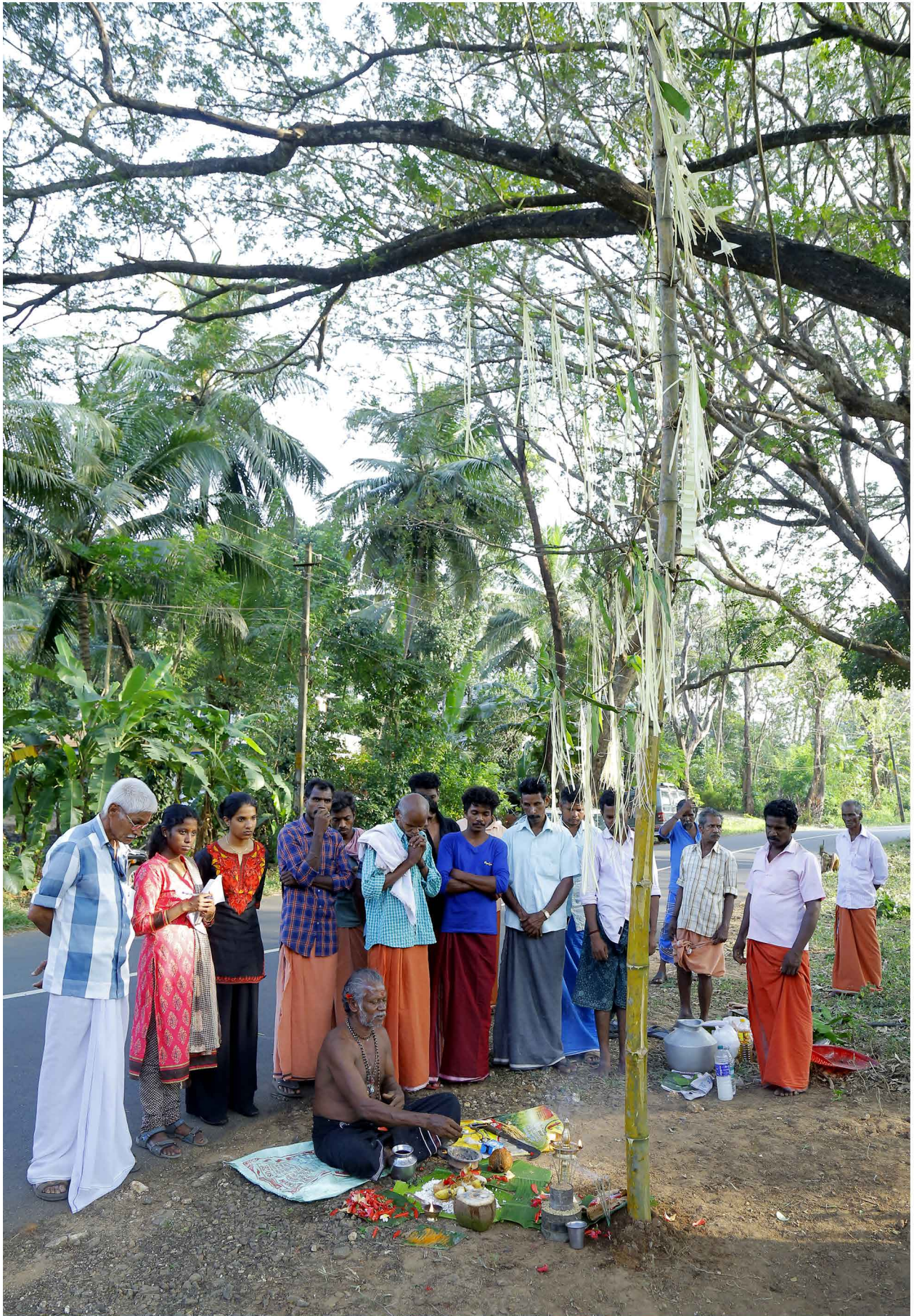
ചിത്രം: 33 കൊടിക്കൂറിയെ പുജചെയ്യുന്ന മുപ്പൻ 37