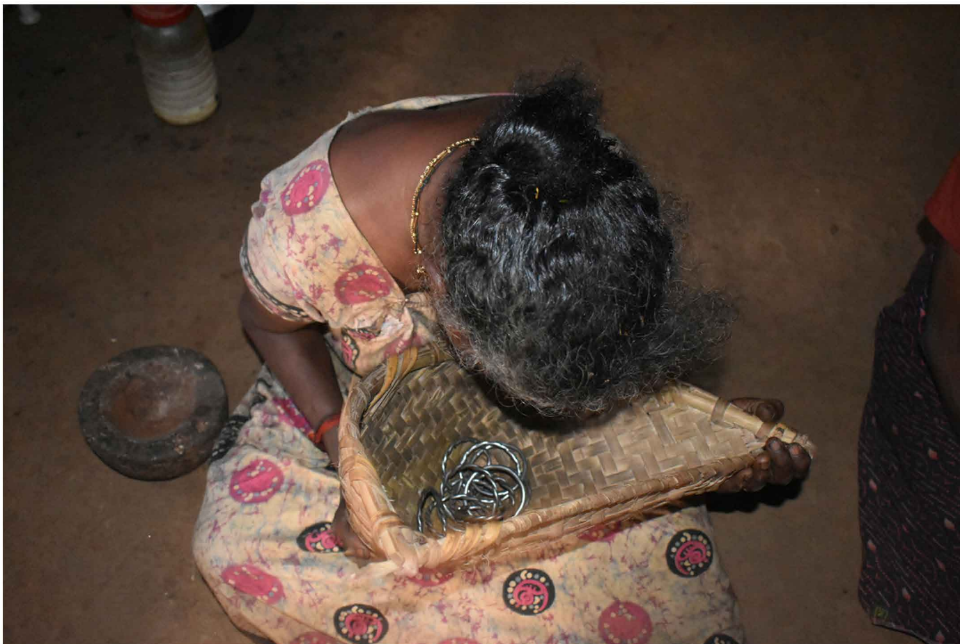
ചിത്രം: 29 മുറംകുലുക്കിപ്പാട്ട് പാടുന്ന മൂപ്പത്തി 30

ഗോത്ര വിശ്വാസ പ്രകാരം മരണത്തോടെ ഒരാളുടെ ജീവിതം കഴിയുന്നില്ല. അയാൾ മറ്റൊരു ലോകത്തിലേക്ക് യാത്രയാവുന്നുവെന്ന് മാത്രം. എന്നാൽ ആഗ്രഹിക്കുമ്പോഴെല്ലാം ഭൂമിയിലെ തന്റെ രക്തബന്ധുക്കളെ കാണുവാനായി ദൈവതുല്യരായ പൂർവ്വികർ ഭൂമിയിൽ വീണ്ടും വീണ്ടും 'സാനിഡ്യം' ഉണ്ടാക്കിക്കൊണ്ടിരിക്കുന്നു.