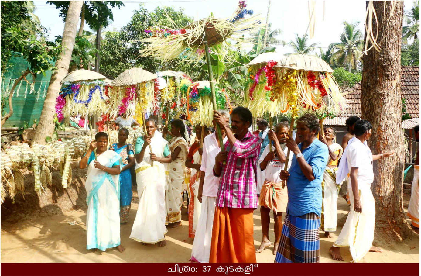
ചിത്രം: 37 കൂടകളി 41