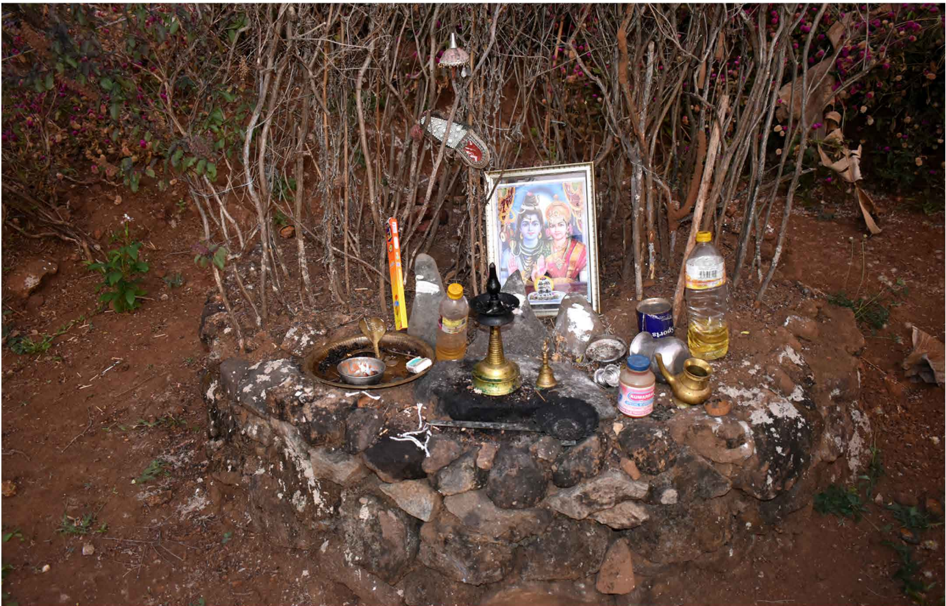
ചിത്രം: 28 മലവാഴിമാർ, മുത്യേനിമാർ, ചാനിമാർ എന്നിവരെ പ്രതിഷ്ഠിച്ച ദൈവത്തറ 29

പ്രകൃതിയുടെ താളത്തിനൊത്തൊഴുകിയിരുന്ന ഗോത്രജീവിതങ്ങൾക്ക് പ്രകൃതി ശക്തിയെ കവച്ചുവെയ്ക്കുന്ന മറ്റൊരാധന ഉണ്ടായിരുന്നില്ല. മരിച്ചു തലയ്ക്കുമുകളിൽ നിൽക്കുന്ന പൂർവ്വികരുടെ ആത്മാവും പ്രകൃതിശക്തികളും മറ്റൊരുഗോത്രങ്ങളെയും പോലെ മലയനും കൂട്ടായി. കൊണ്ടിച്ചേരി, മലവാഴിമാർ, അച്ഛൻ മുത്തൻ, കാരണവൻമാർ, പേറ്റിക്കാരി, അമിച്ചിമാർ, മുത്യേനിമാർ, ചാഴിമാർ, വനദേവത, മുത്തപ്പൻ, കണ്കർണ്ണൻ, നീലിയമ്മ തുടങ്ങി ഓരോ ഊരിനും സ്വന്തമായ് ദൈവങ്ങളുണ്ടായിരുന്നു. എന്നാൽ ശിവനും പാർവ്വതിയും കൊടുങ്ങല്ലൂരമ്മയുമടക്കമുള്ള ദൈവങ്ങളാൽ കുലദൈവങ്ങൾ ഏറെക്കുറെ വിസ്തരിക്കപ്പെട്ട അവസ്ഥയിലാണ്. ഇങ്ങനെയൊക്കെയാണെങ്കിലും വിശ്വാസം ശ്വാസം പോലെ കളങ്കമറ്റതാണെന്നും മലയർക്ക്.