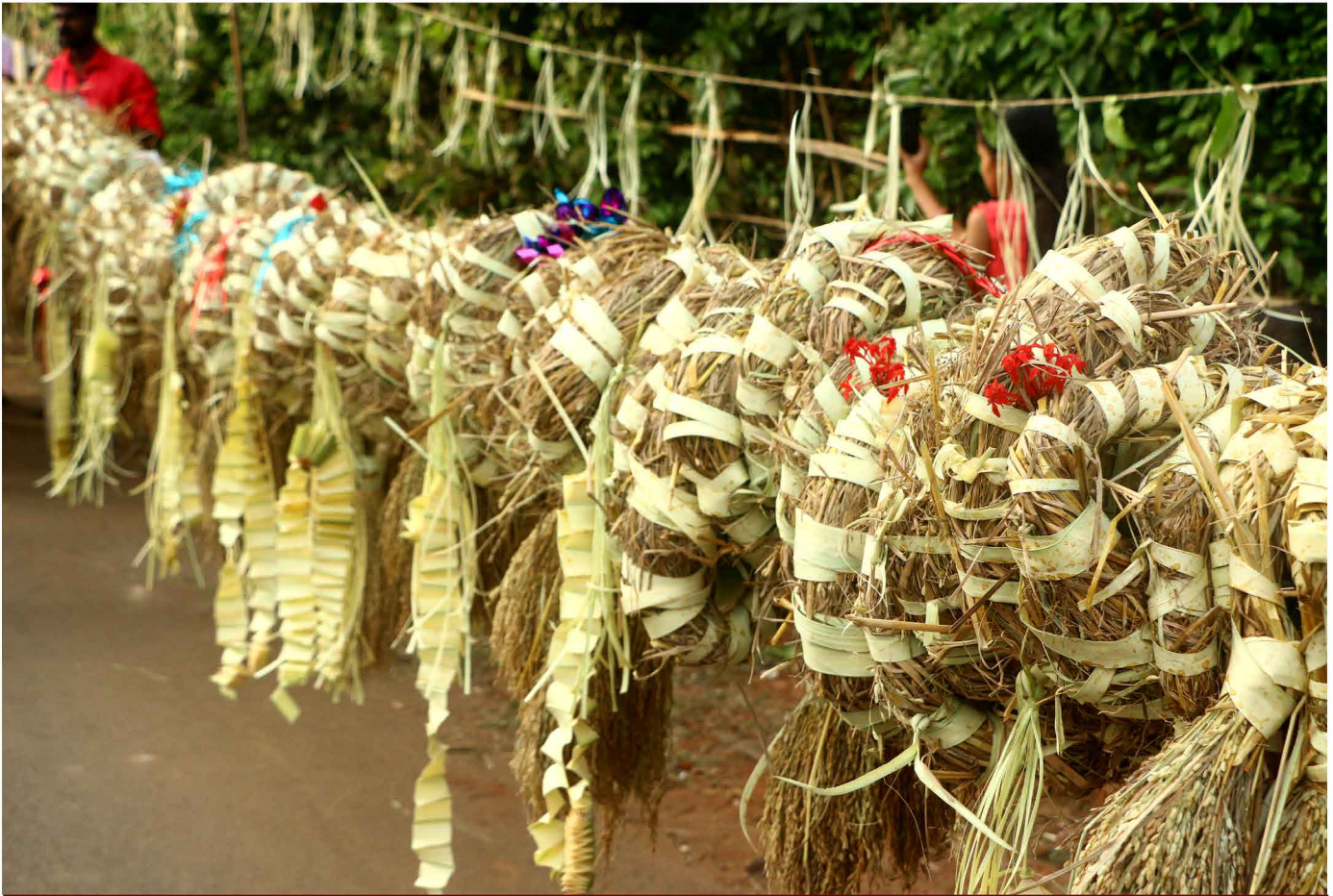
ചിത്രം: 36 പണ്ടാരത്തണ്ടിലേറിയ കതിർക്കൂട്ടുകൾ 40

മാവിലയും കുരുത്തോലയും ചെമ്പരത്തിപ്പൂവും കൊണ്ടലങ്കരിച്ച പൂക്കൂടയും നെടിയകൂടയും പണ്ടാരത്തണ്ടും, ചുണ്ണാമ്പും മഞ്ഞളും കലർത്തിയ വെള്ളത്താൽ ഗുരുതി നടത്തി, കൊടി മരപൂജക്ക് ശേഷം, നെടിയകൂടയിൽ കുറുമാലിയമ്മയ്ക്കുള്ള പട്ട് കെട്ടി കുറുമാലിക്കാവി ലേക്ക് പാട്ടും നൃത്തവും വാദ്യഘോഷവും കൊണ്ട് ആവേശഭരിത മായ യാത്രയാണ്...അമ്മയെ കാണാൻ പറഞ്ഞ വാക്ക് പാലിക്കാൻ നന്ദി പറയാൻ...കുറുമാലിക്കാവിൽ ആദ്യം കയറ്റുന്നത് പന്നിക്കുളമ്പ് ഭാഗത്തെ മലയരുടെ കതിർക്കൂടാണ്.