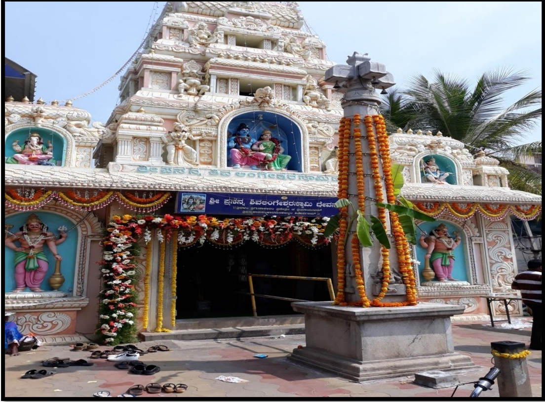
ಪ್ರಸನ್ನ ಶಿವಲಿಂಗೇಶ್ವರಸ್ವಾಮಿ ದೇವಾಲಯ ಕುವೆಂಪುನಗರ