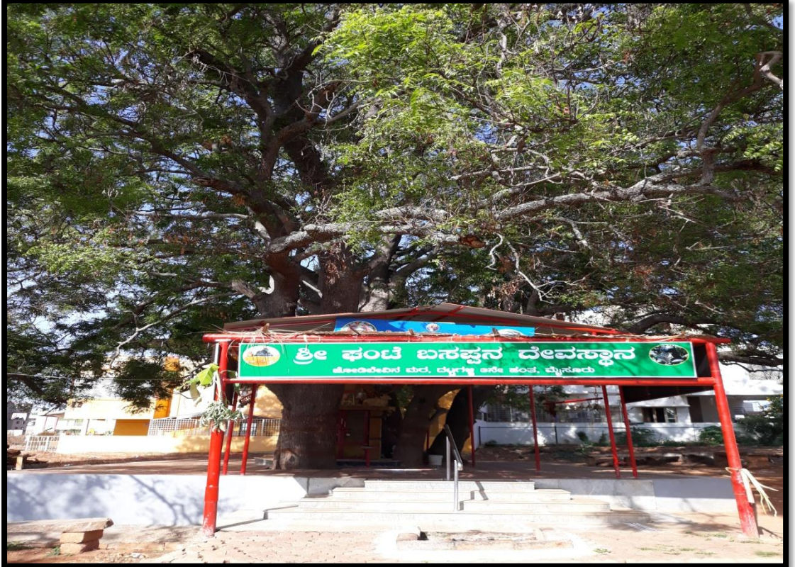
ಘಂಟೆ ಬಸವ್ವನ ದೇವಸ್ಥಾನ, ದಟ್ಟಿಗಲ್ಲಿ