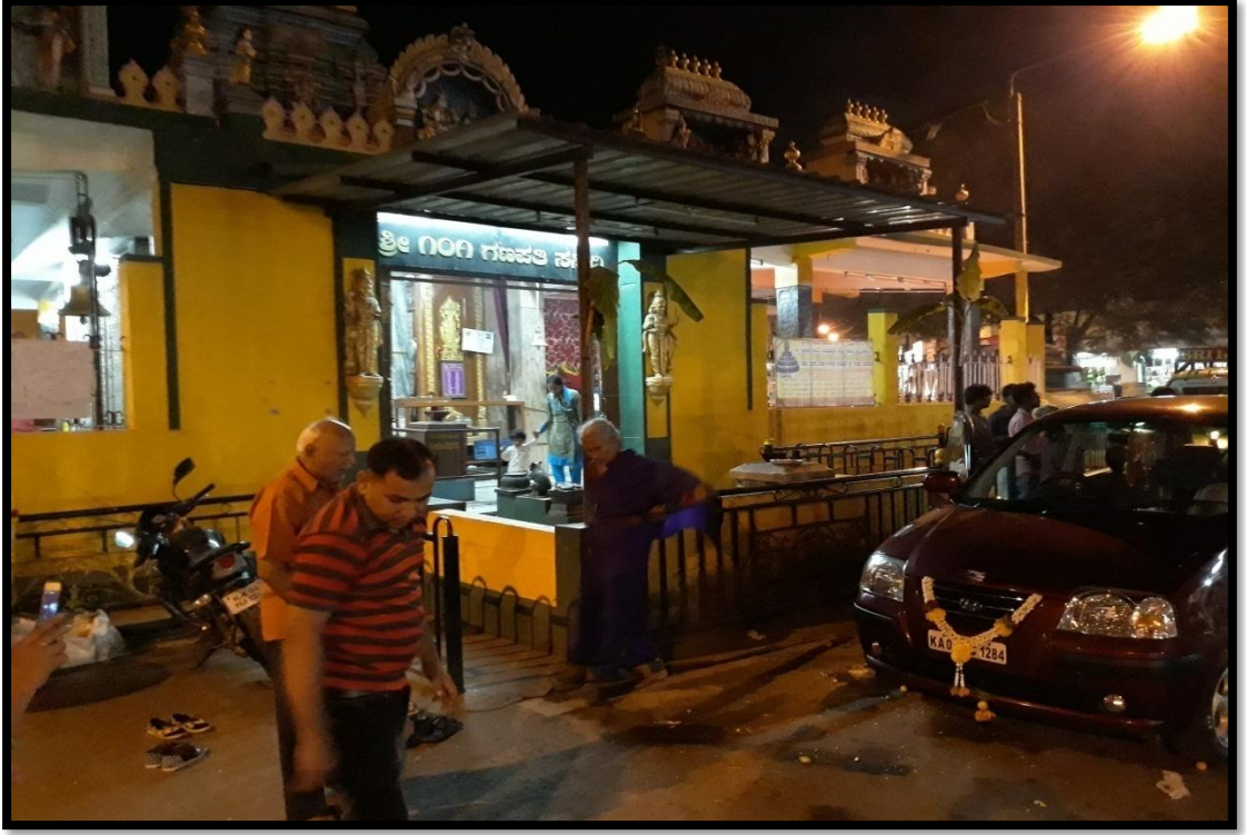
ನೂರೊಂದು ಗಣಪತಿ ದೇವಾಲಯದಲ್ಲಿ ವಾಹನ ಪೂಜೆ ಮಾಡಿಸುತ್ತಿರುವುದು