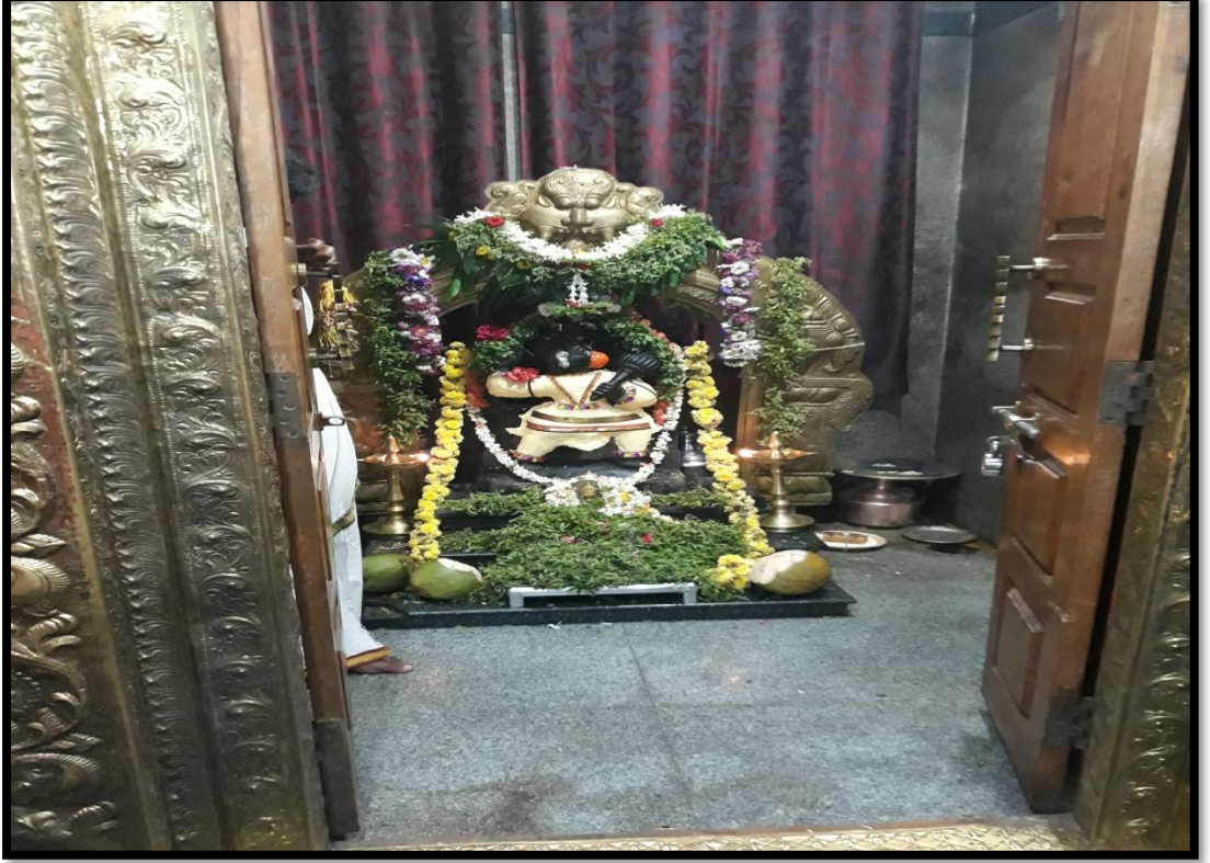
ಆಂಜನೇಯ ದೇವಾಲಯ, ಕುವೆಂಪುನಗರ