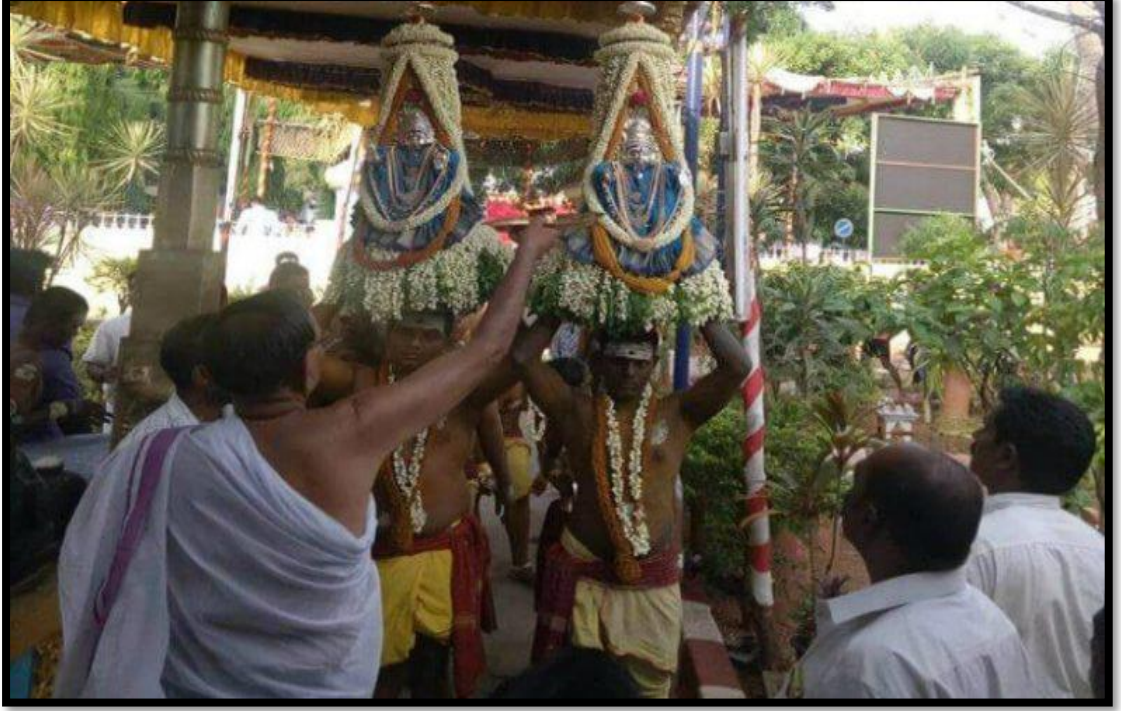
ಕರಗಕ್ಕೆ ಪೂಜೆ ಸಲ್ಲಿಸುತ್ತಿರುವುದು