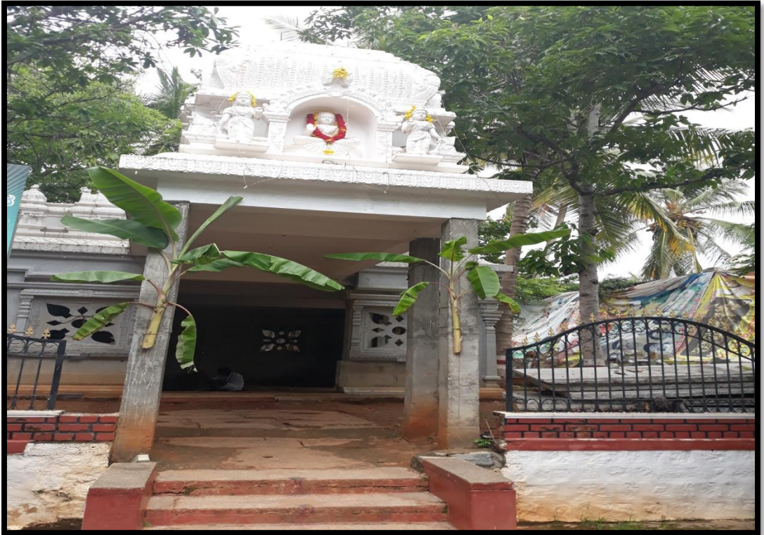
ದೊಡ್ಡಮ್ಮ ತಾಯಿ ದೇವಾಲಯ ತೊಣಚಿಕೊಪ್ಪಲು