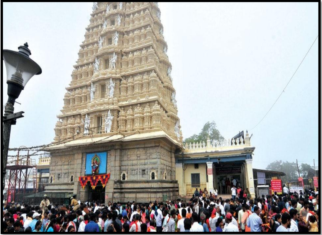
ಚಾಮುಂಡೇಶ್ವರಿ ದೇವಾಲಯ, ಚಾಮುಂಡಿಬೆಟ್ಟ