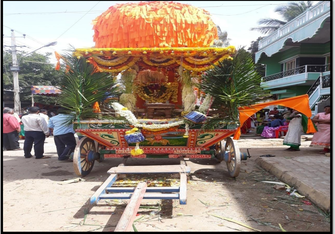
ಸಿದ್ದಪ್ಪಾಜಿ ತೇರು ಅಶೋಕಪುರಂ