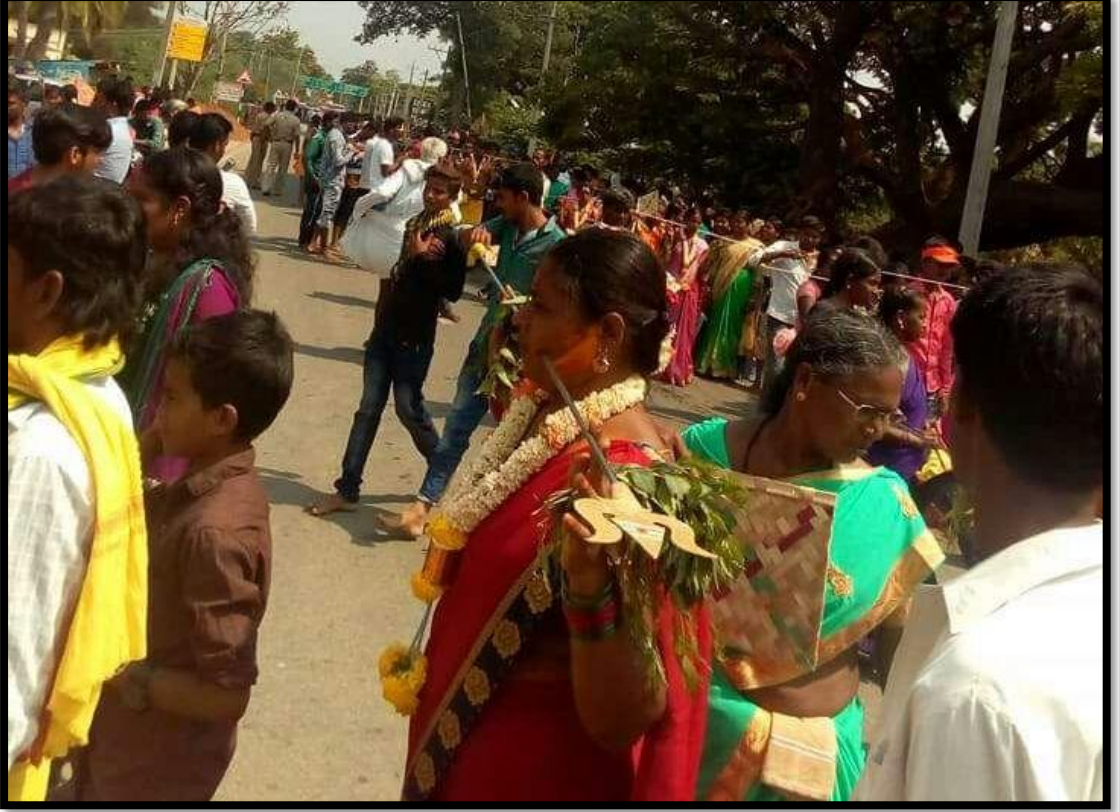
ಬಾಯಿಬೀಗದ ಹರಕೆ ತೀರಿಸುತ್ತಿರುವ ಮಹಿಳೆ