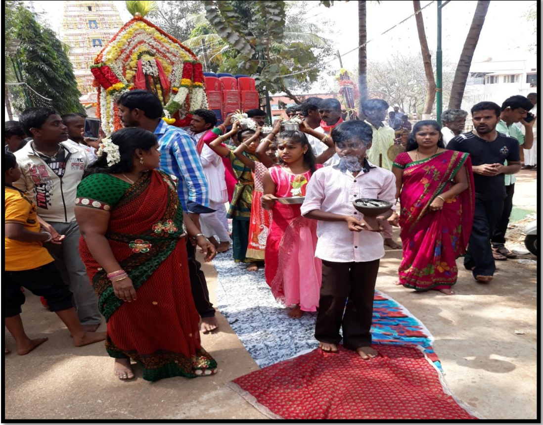
ನಡೆ ಮಡಿಹಾಸಿನ ಮೇಲೆ ಸಾಗುತ್ತಿರುವುದು