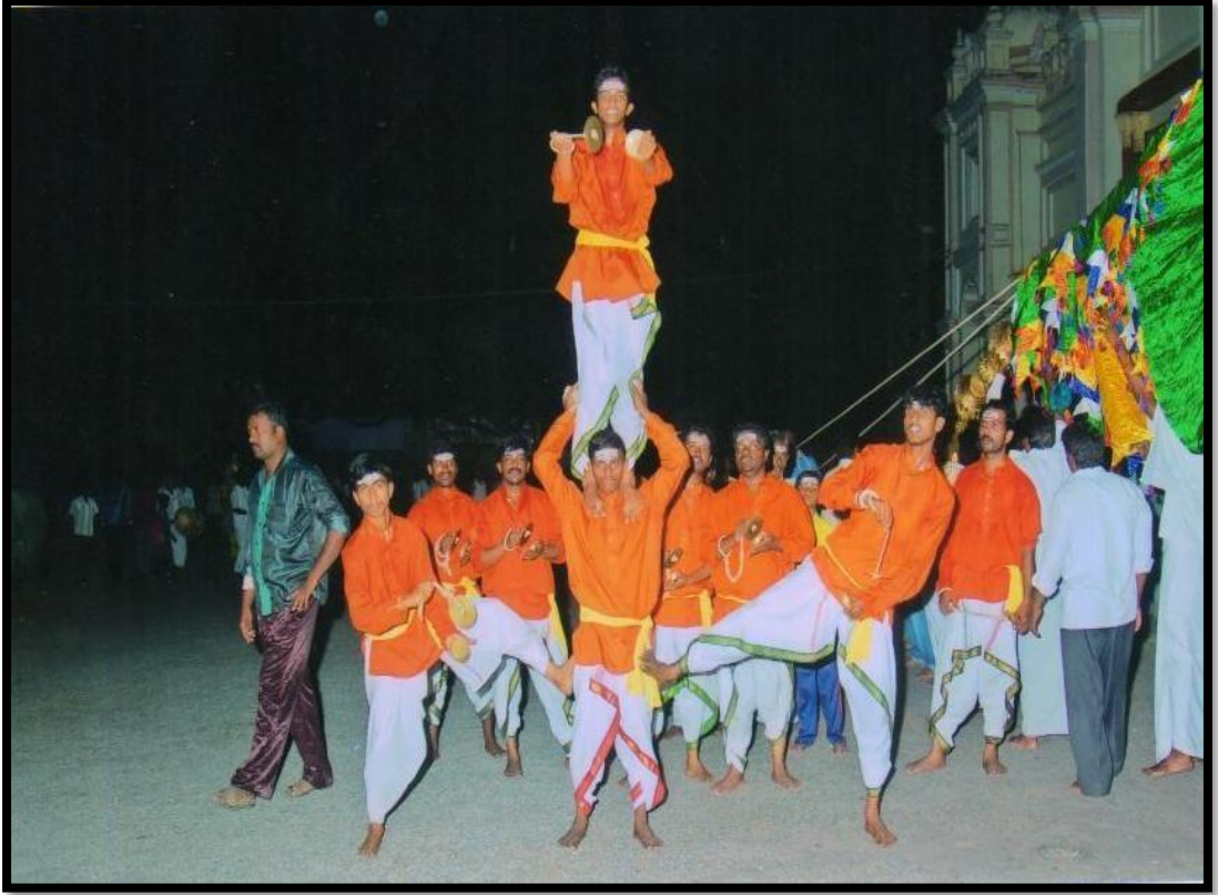
ಬೀಸು ಕಂಸಾಳೆ ನೃತ್ಯ