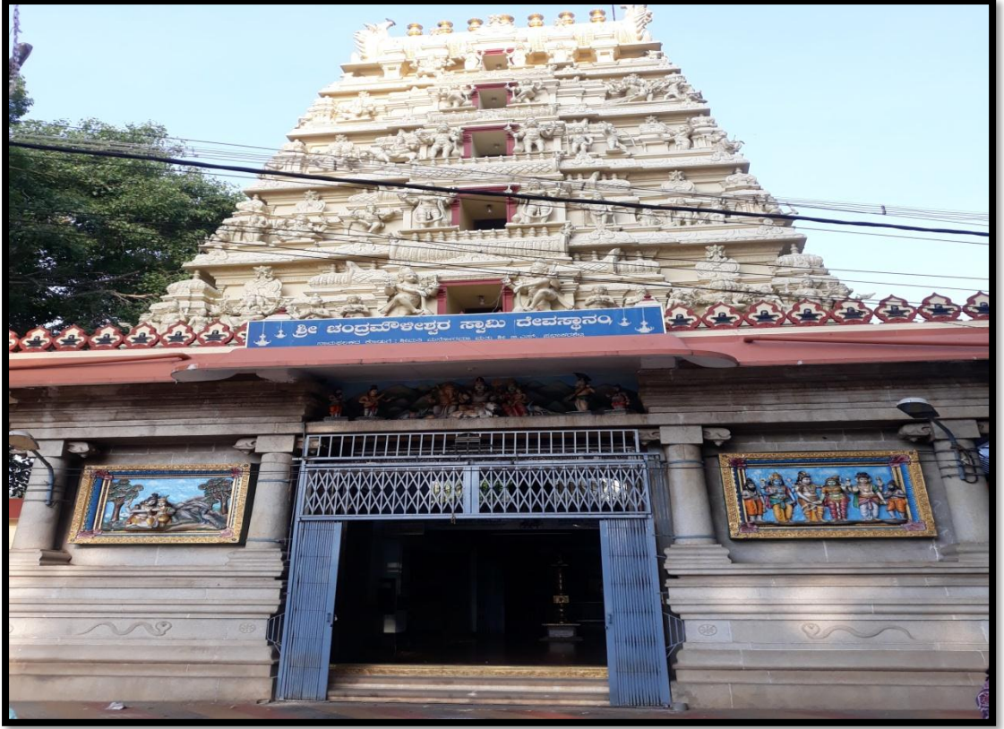
ಚಂದ್ರಮಾಲೇಶ್ವರ ದೇವಾಲಯ, ಕೆ.ಇ.ಬಿ ಸರ್ಕಲ್