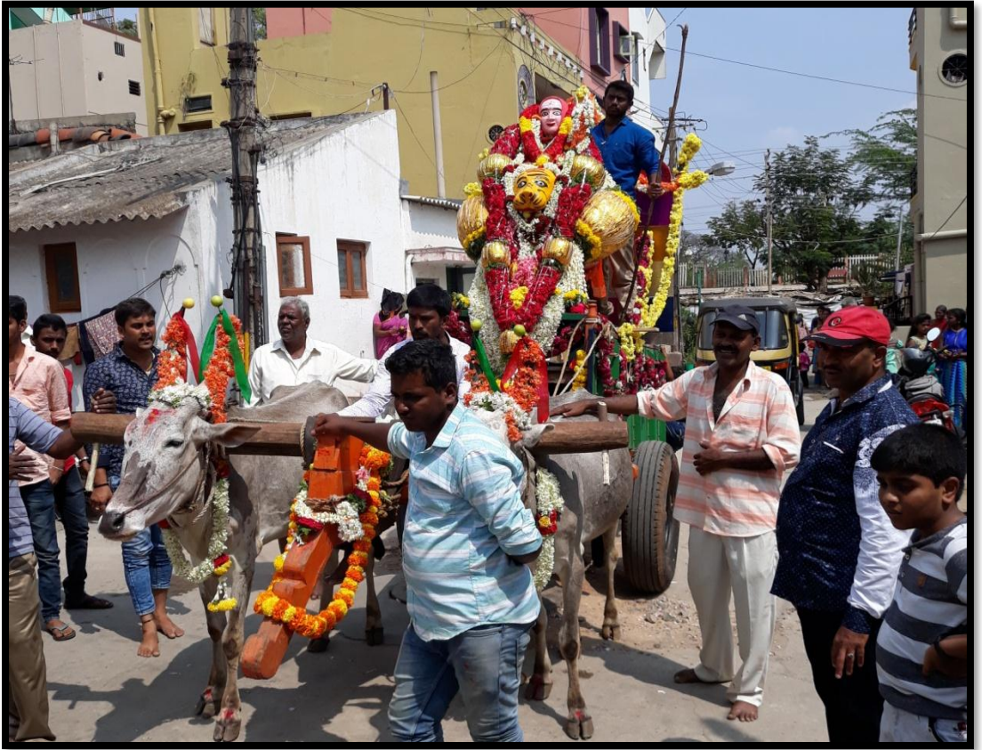
ಹುಲಿ ವಾಹನದ ಮೇಲೆ ಮಾದೇಶ್ವರ ಮೆರವಣಿಗೆ