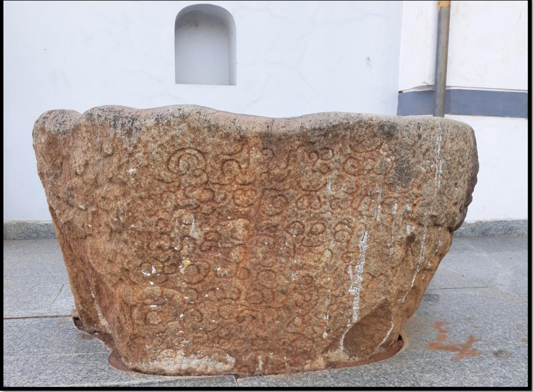
ಎಣ್ಣೆಗಾಣ ನನ್ನೇಶ್ವರ ದೇವಾಲಯ, ಹಿನಕಲ್