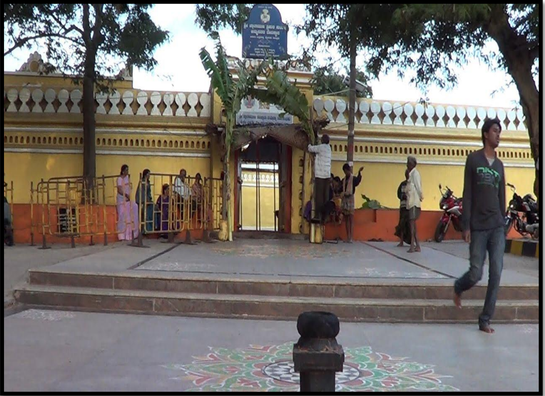
ಉತ್ತನಹಳ್ಳಿ ಮಾರಮ್ಮ ದೇವಾಲಯ