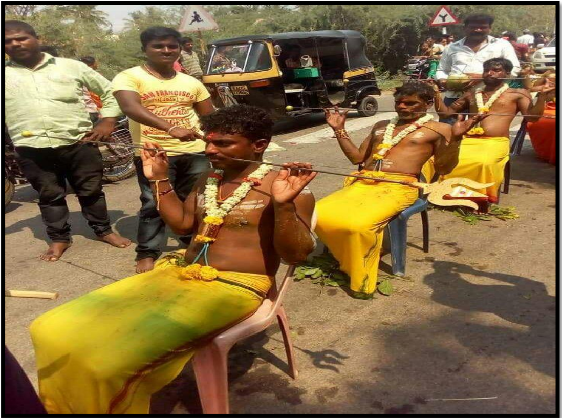
ಬಾಯಿಬೀಗದ ಹರಕೆ ತೀರಿಸುತ್ತಿರುವುದು