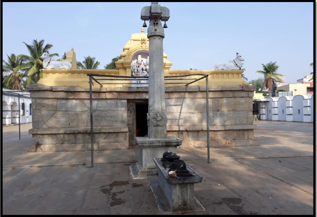
ನನ್ನೇಶ್ವರ ದೇವಾಲಯ, ಹಿನಕಲ್