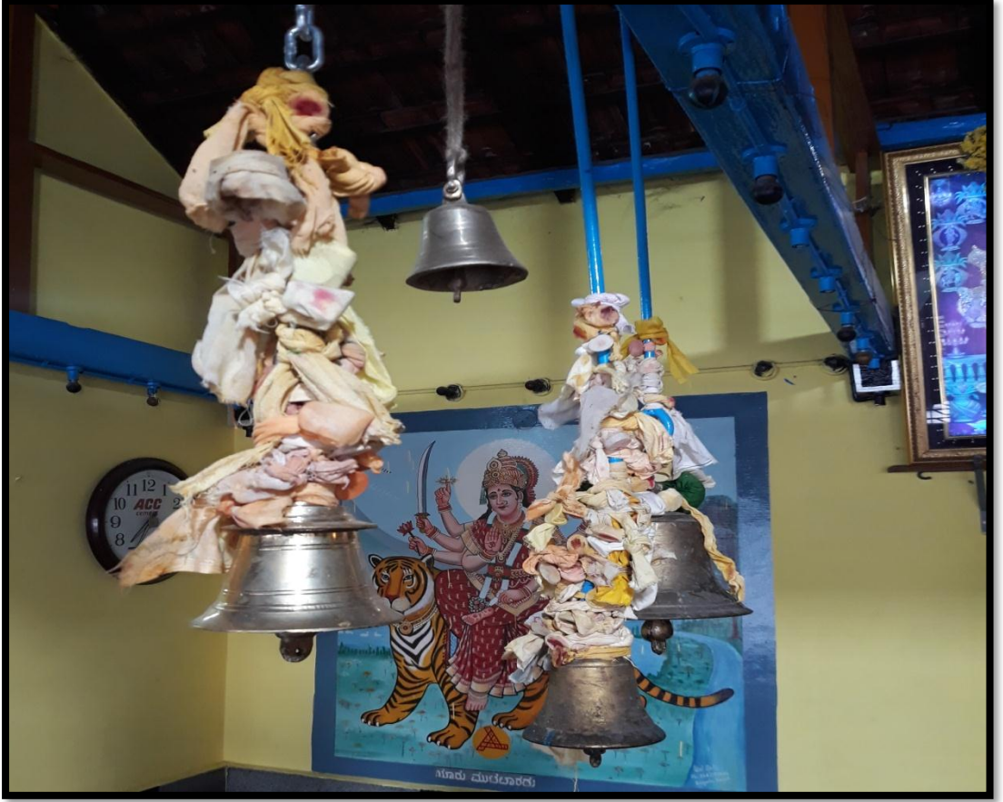
ಹರಕೆಯ ಕಾಸನ್ನು ಘಂಟೆಗೆ ಕಟ್ಟಿರುವುದು