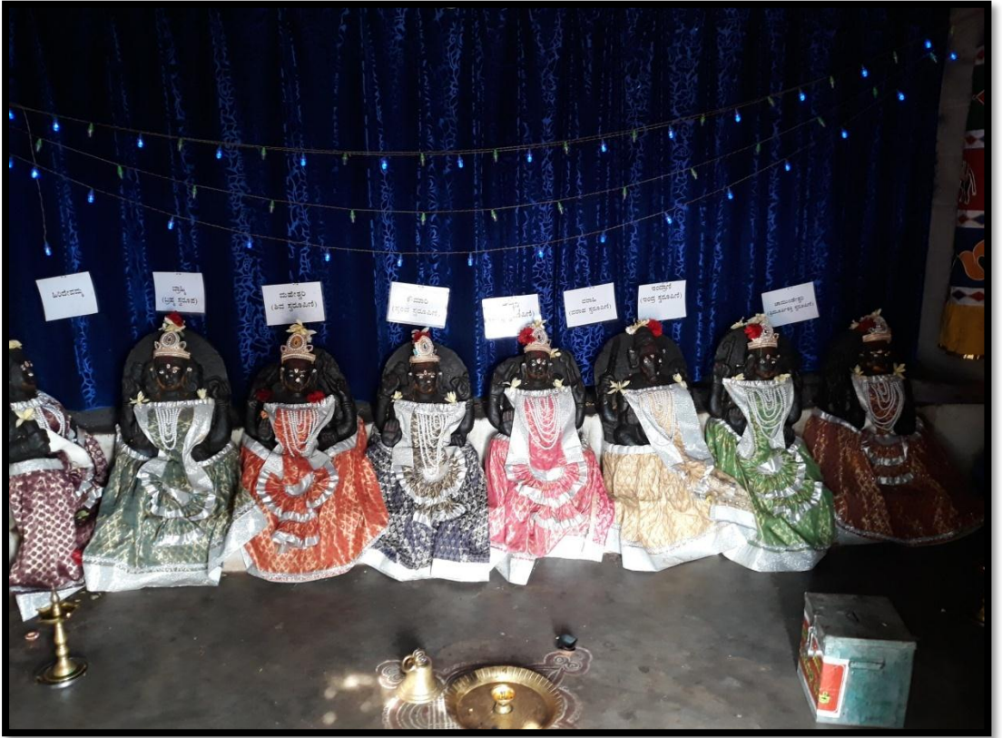
ಸಪ್ತಮಾತೃಕೆ ದೇವಾಲಯ ಬೋಗಾದಿ