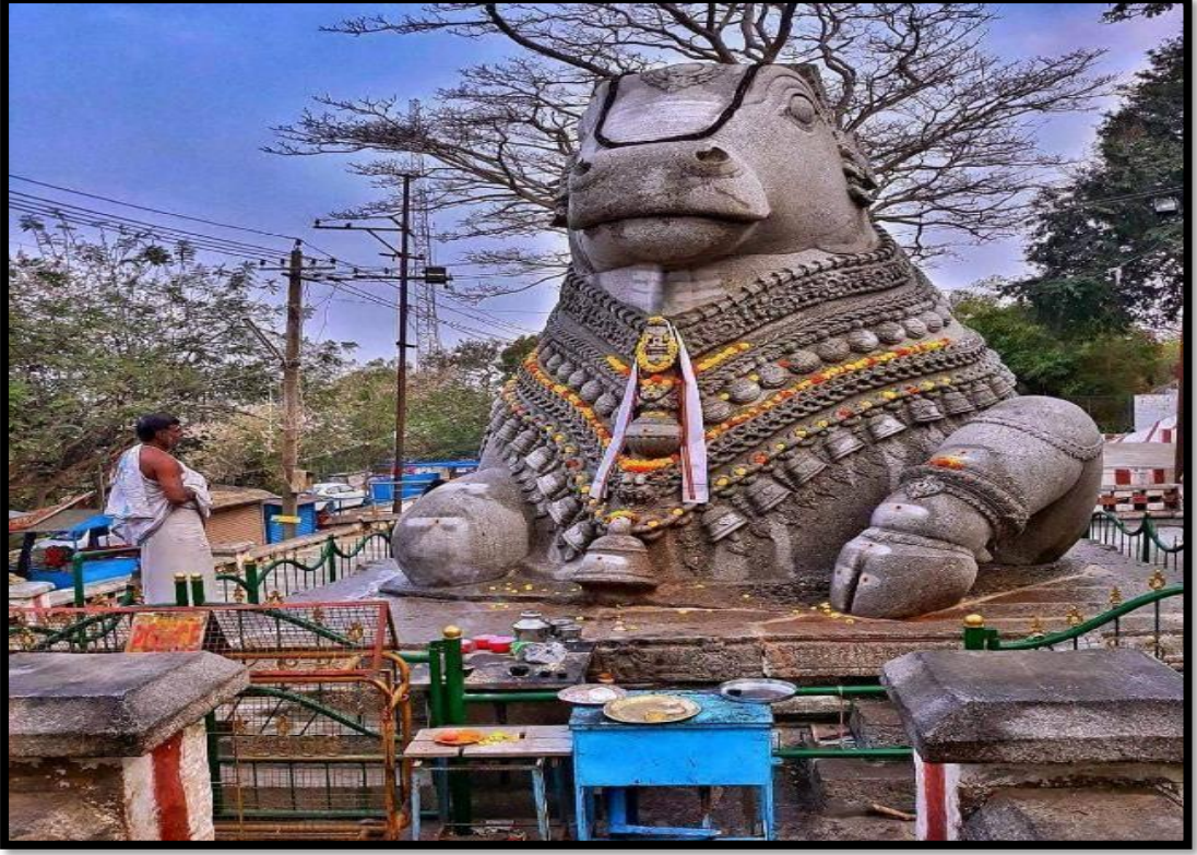
ಚಾಮುಂಡಿಬೆಟ್ಟದ 700ನೇ ಮೆಟ್ಟಲಿನಲ್ಲಿರುವ ನಂದಿ