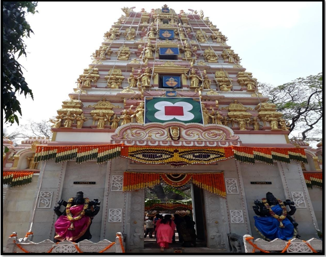
ಬಿಸಿಲು ಮಾರಮ್ಮ ದೇವಾಲಯ