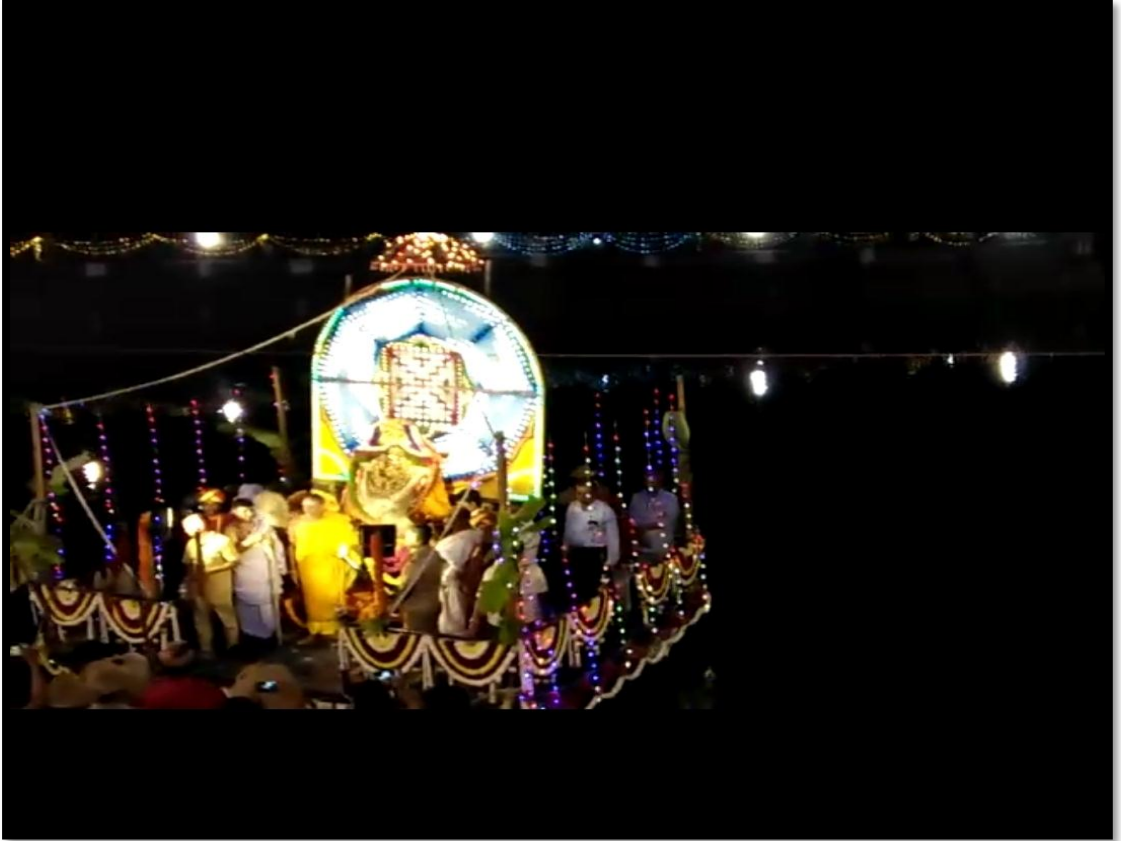
ಚಾಮುಂಡೇಶ್ವರಿ ತೆಪ್ಪೋತ್ಸವ ದೇವಿಕೆರೆ