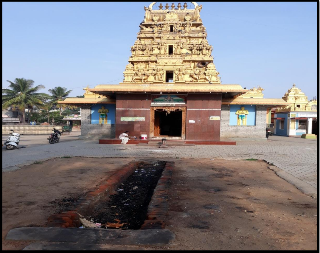
ಮಾದೇಶ್ವರ ದೇವಾಲಯ ಕುಂಬಾರಕೊಪ್ಪಲು