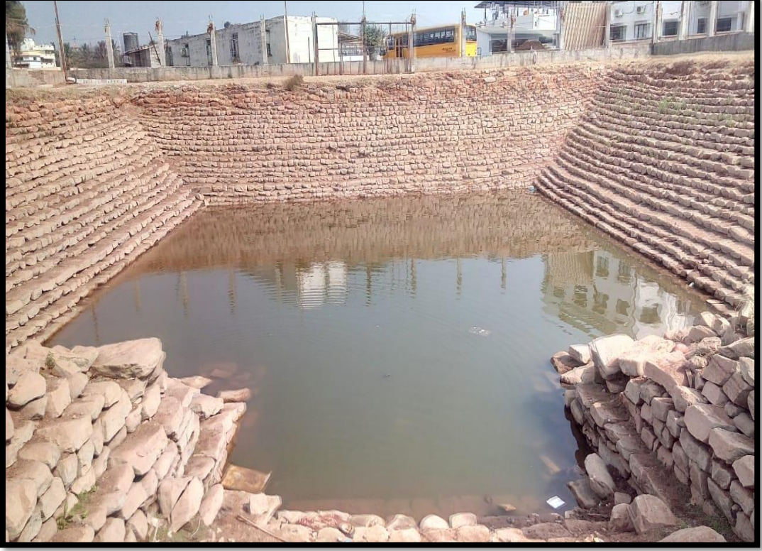
ನನ್ನೇಶ್ವರ ದೇವಾಲಯದ ಕಲ್ಯಾಣಿ, ಹಿನಕಲ್