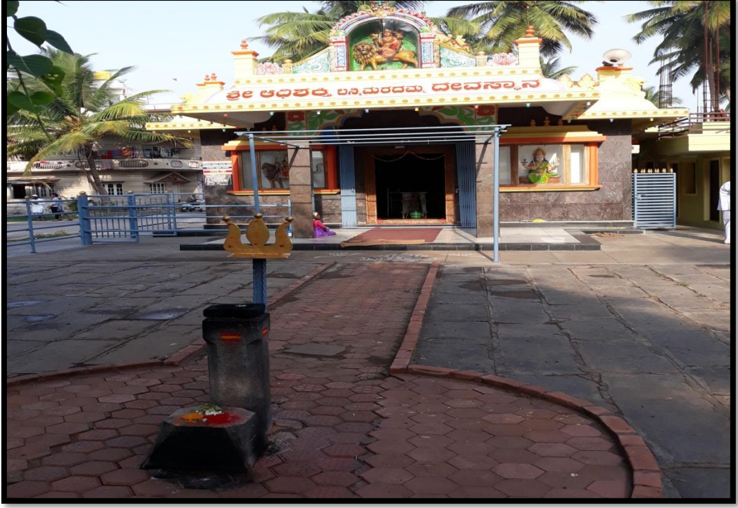
ಅಧಿಶಕ್ತಿ ಬನ್ನಿಮರದಮ್ಮ ದೇವಾಲಯ ಕುಂಬಾರಕೊಪ್ಪಲು