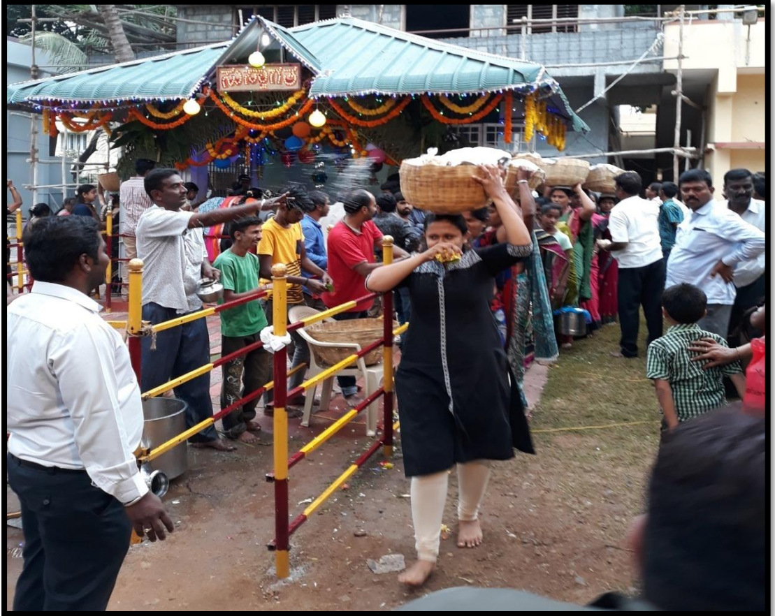
ಎಡೆ ಹೊತ್ತು ಸಾಗುತ್ತಿರುವುದು ಬಂದಂತಮ್ಮ ಕಾಳಮ್ಮ ದೇವಾಲಯ ಕನ್ನೆಗೌಡನ ಕೊಪ್ಪಲು