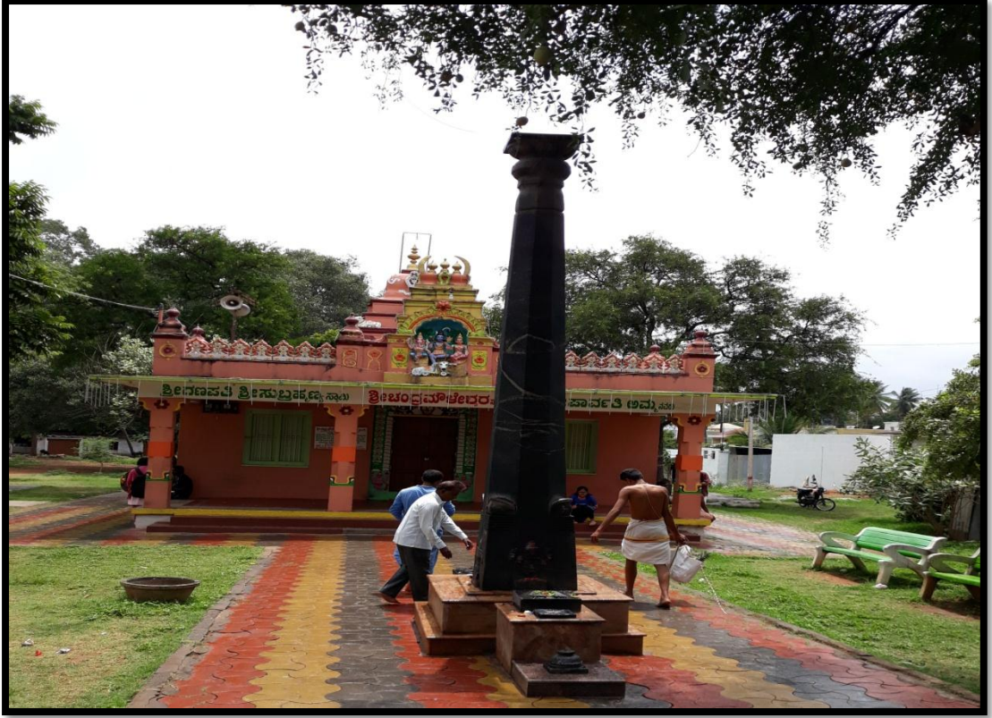
ಚಂದ್ರಮೌಳೇಶ್ವರ ದೇವಾಲಯ ಸರಸ್ವತಿಪುರಂ