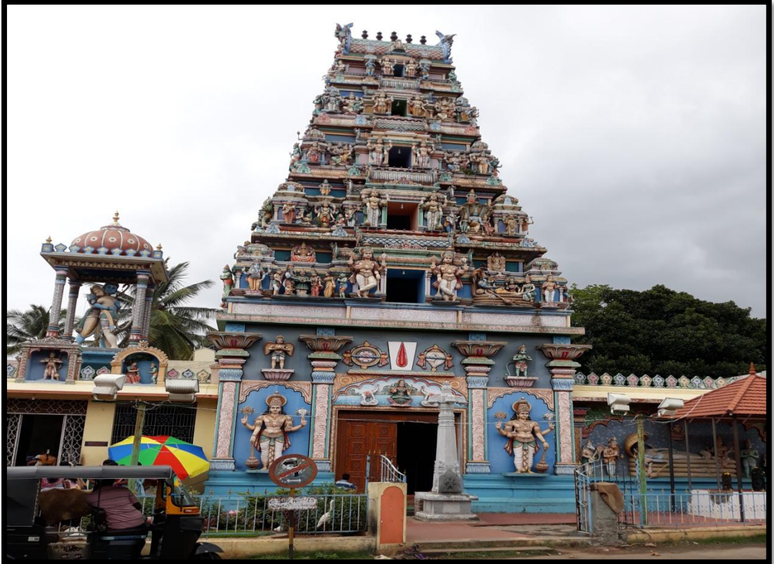
ಮಾರುತಿ ದೇವಾಲಯ ತೊಣಚಿಕೊಪ್ಪಲ