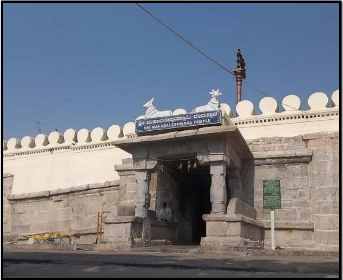
ಮಹಾಬಲೇಶ್ವರ ದೇವಾಲಯ ಚಾಮುಂಡಿಬೆಟ್ಟ