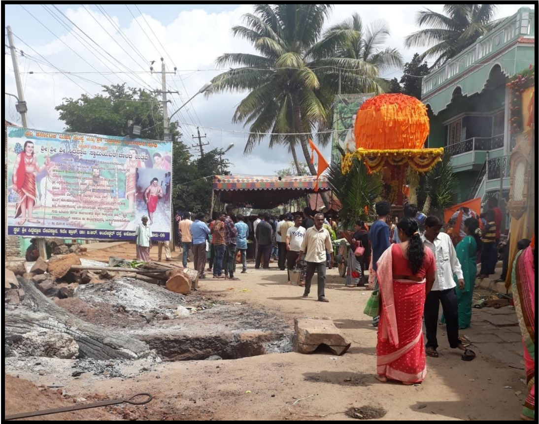
ಅಶೋಕಸುರನ ಸಿದ್ದಪ್ಪಾಜಿ ದೇವಾಲಯದ ಮುಂದೆ ಕೊಂಡ ಹಾಕಿರುವುದು