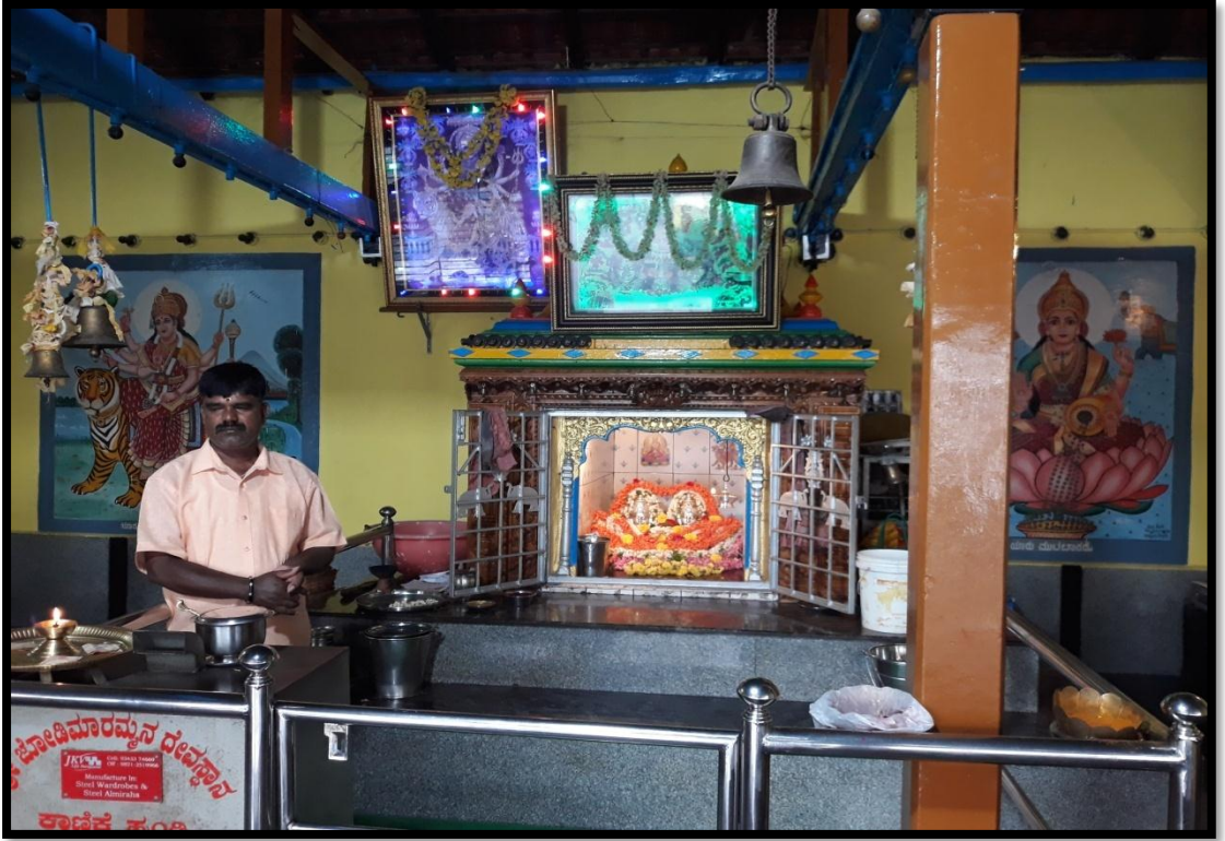
ಜೋಡಿ ಮಾರಮ್ಮ ದೇವಾಲಯ ಪಡುವಾರಹಳ್ಳಿ