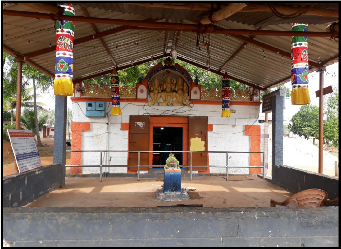
ಭೋಗೇಶ್ವರ ದೇವಾಲಯ ಬೋಗಾದಿ