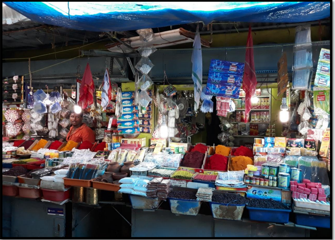
ಪೂಜಾ ಸಾಮಗ್ರಿಗಳ ಅಂಗಡಿ