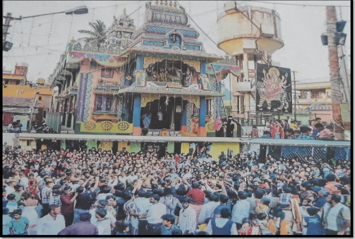
ಕೃತಮಾರನಹಳ್ಳಿ ಹುಲಿಯಮ್ಮ ಜಾತ್ರೆ