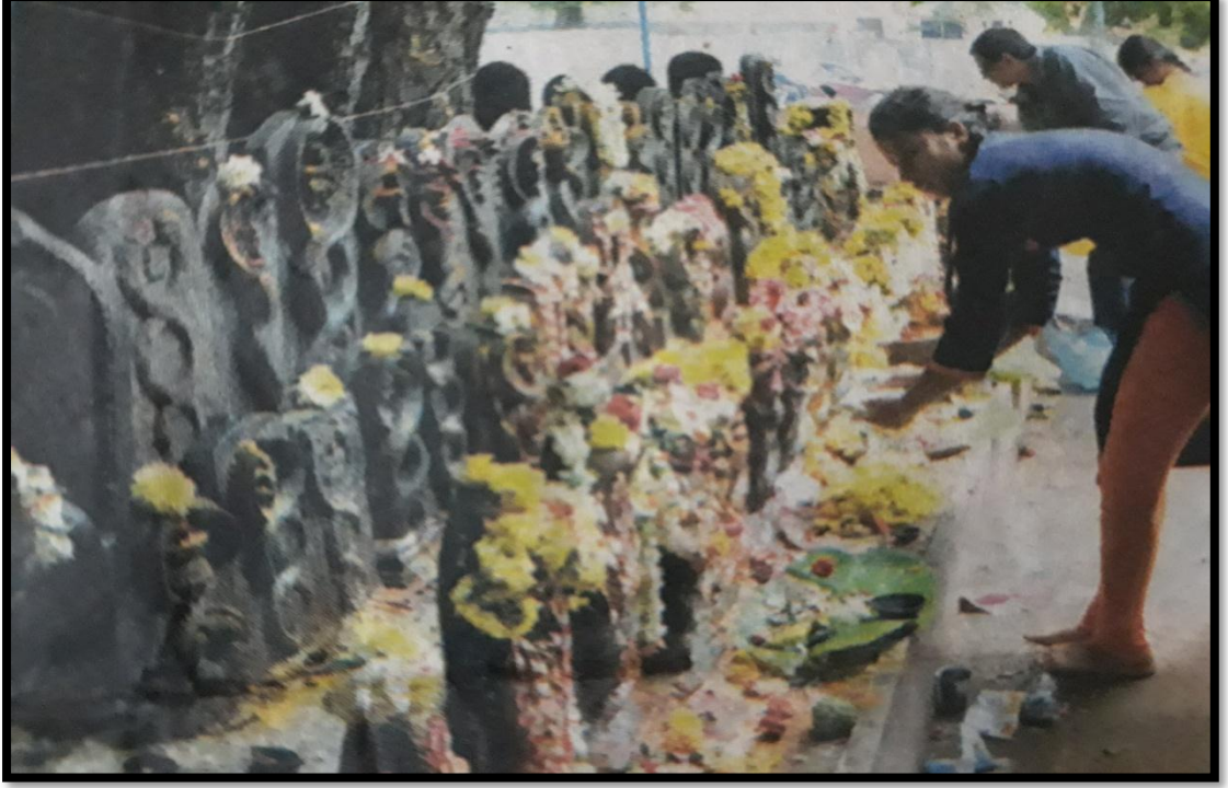
ನಾಗರಕಲ್ಲಿಗೆ ಪೂಜೆ ಸಲ್ಲಿಸುತ್ತಿರುವುದು